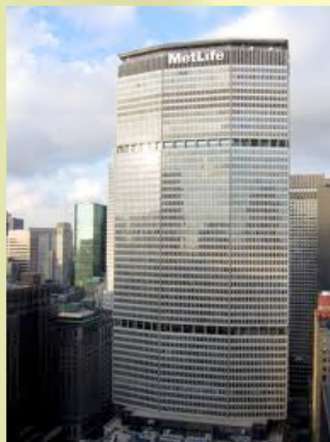
5. ábra: Walter Gropius és The Architects' Collaborative, Pietro Belluschi és Emery Roth and Sons: „Grand Central City Building” (PANAM), New York, befejezve 1963-ban. 59 emeletes épület, amely keresztben áll a Park Avenue fölött, az egész környezet új súlypontját teremti meg.