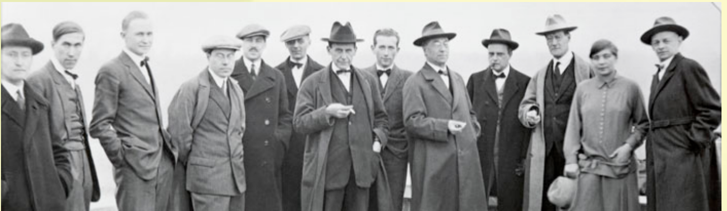
3. ábra: A dessaui Bauhaus-épület tetején, balról: Josef Albers, Hinnerk Scheper, Georg Muche, Moholy-Nagy László, Herbert Bayer, Joost Schmidt, Walter Gropius, Breuer Marcel, Vaszilij Kandinszkij, Paul Klee, Lyonel Feininger, Gunta Stölzl és Oskar Schlemmer.