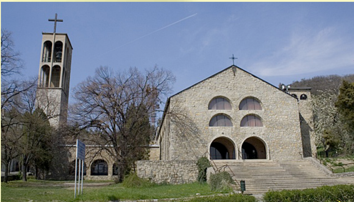
6. ábra: Weichinger Károly: A Pálóczi Római Katolikus Templom és kolostora Pécsen (1932)

Magyarországon is érvényesült a 20-30-as évek modernista esztétikája és képviselői. A modernizmus politikailag motivált szemléletét elutasító akkori állami megrendelők kevésbé foglalkoztatták őket Budapesten, mint inkább a vidéki városokban, jelesül Pécsen. Így inkább a magánberuházások területén maradt ránk komoly építészeti értéket képviselő, egyértelmű szándékokat kifejező, letisztult és racionális architektúrájú épületek. Ezeket eredeti formájukban ma már kevésbé élvezhetjük, eltekintve a műemléki védelem alá vett házaktól. Az itthon is egyre elfogadottabb minimalista irányzatok révén az új keletű egyszerűség, letisztult, funkcionális formavilág is helyet talált magának az építészetben és a belsőépítészetben (Rothmann G. 2010). Felértékelődtek a két világháború közötti épületek és belső terek is, a modernség forrásvidéke, különösen a kiemelkedő magyar részvétellel működő, legendássá vált Bauhaus.