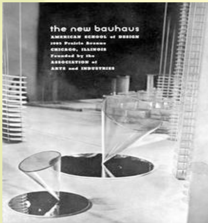
4. ábra: Moholy-Nagy László, brosúra a „New Bauhaus”, Chicago