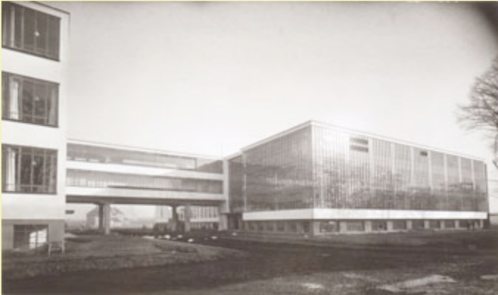
2. ábra: Walter Gropius: Bauhaus Dessau, 1925/26, északnyugati nézet, fotó: Lucia Moholy, 1926

A művészek és a képművesek, a tanítás és a tervezés, a szépművészet és az iparművészet közötti megkülönböztetés hatályát veszítette. „A művészet és a technológia - az új egység”- hirdették, az iparági lehetőségeket ki kell használni, cél a funkcionális és esztétikus design. A Bauhaus-műhelyekben előállított prototípusok célja a tömeges gyártás volt. Végeredményben az I. világháború hatására létrejött gépipari gyártási technológiát használták ki a tömegtermelés céljaira.