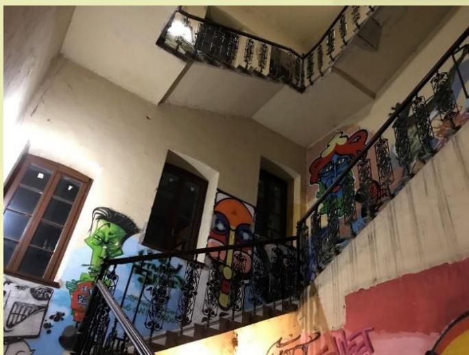
7. ábra: Lépcsőház a Nappaliban.

A kreatív osztály keze munkája a falakról köszön visza, melyet az alábbi fényképekkel mutatok be. Látható, hogy a vendéglátóhely közössége már- már szubkulturálként működve saját normarendszert állít fel a falakon belül, erre kiváló példa az ablakban állandó jelleggel kifüggesztett LGBTQ+ zászló, vagy a számos civil szervezettel közösen szervezett rendezvény, melyek legtöbbször a fenntarthatóság, a hátrányos helyzetű kisebbségek, vagy a nők helyzetének tematikáját célozzák, mutatják be az érdeklődőknek. Elmondható tehát, hogy a bárt elsősorban politikailag baloldalra soroló közösség látogatja, ugyanakkor ezáltal a forgalmas helyszín számos súrlódásra enged következtetni a helyi szubkulturák között, vagy legalábbis megosztónak bizonyul a pécsi éjszakai életben.