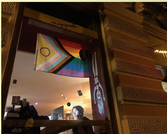
8. ábra: LGBTQ zászló az utcafronton (Nappali).

A kreatív osztály keze munkája a falakról köszön visza, melyet az alábbi fényképekkel mutatok be. Látható, hogy a vendéglátóhely közössége már- már szubkulturálként működve saját normarendszert állít fel a falakon belül, erre kiváló példa az ablakban állandó jelleggel kifüggesztett LGBTQ+ zászló, vagy a számos civil szervezettel közösen szervezett rendezvény, melyek legtöbbször a fenntarthatóság, a hátrányos helyzetű kisebbségek, vagy a nők helyzetének tematikáját célozzák, mutatják be az érdeklődőknek. Elmondható tehát, hogy a bárt elsősorban politikailag baloldalra soroló közösség látogatja, ugyanakkor ezáltal a forgalmas helyszín számos súrlódásra enged következtetni a helyi szubkulturák között, vagy legalábbis megosztónak bizonyul a pécsi éjszakai életben.