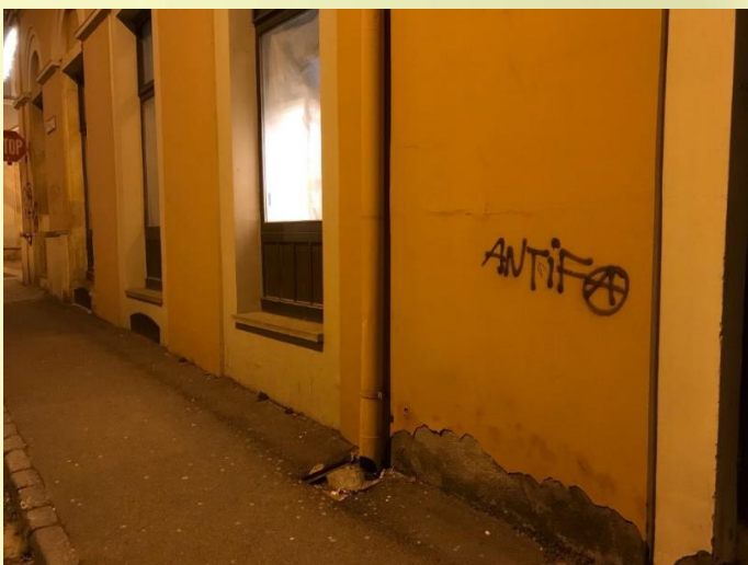
5. ábra: Antifasiszta szimbólum a Felsőmalom és a Király utca keresztesződésénél a Szabadkikötőhöz közeledve.

A dzsentrifikált Lower East Side-i imáztól az utcában haladva hamar elérkezünk a camdeni stílust idéző festményekkel és kulturálisrendezvényekkel operáló, színes, már-már bohémnak mondható városrészbe, mely többek között a kérdőív egyik leggyakrabban említett vendéglátóhelyének, a Nappali Bárnak is otthont ad.