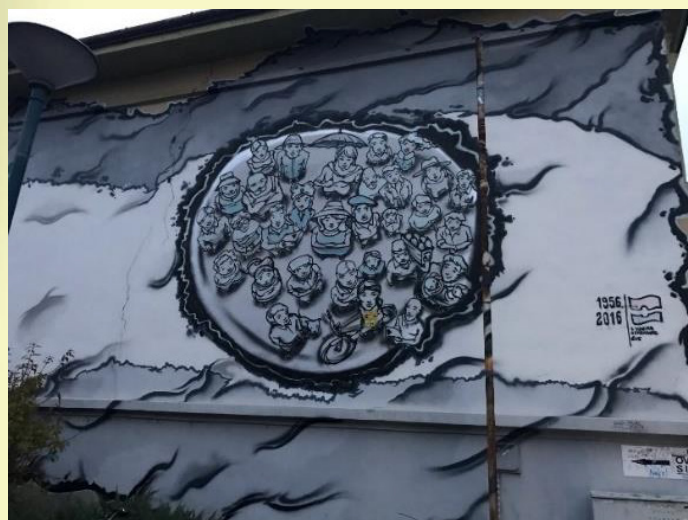
9. ábra: Street art a Csinos presszó falán.

Kutatásom második kiemelkedő eredménnyel (18%) rendelkező helyszíne a különösen fiatalok körében népszerű, hosszú múltra visszatekintő Csinos Presszó, amely különleges módon pusztán „általános” szolgáltatásaival tett szert vendégkörére. Rendezvények tekintetében elmarad a többi vendéglátóhelytől, zenei programok nem kerülnek megszervezésre. Szubkulturális szinten mindazonáltal híresnek mondható, az ingatlant végig járva számos csoport matricáival, festményeivel és egyéb felirataival találkozhatunk, ezek közül pedig a legjellegzetesebb talán az épület oldalfalán látható az 1956-ra emlékező festmény, amely minden bizonnyal kimeríti a street art kifejezés jelentését.