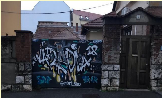
3. ábra: Street art a Váradi Antal utca 18. kapuján (A Csinos Presszó közelében).

is meglátszanak. Ez alól a Downtown Bár képez egyedüli kivételt, amely a kérdőív adatai szerint nem lépte át a küszöbértéket, a Facebook követőszám összehasonlítását tekintve pedig 2022.12.21-én 2,2 ezer követővel rendelkezett, szemben például a Csinos Presszóval, amely közel tízezret számlál.