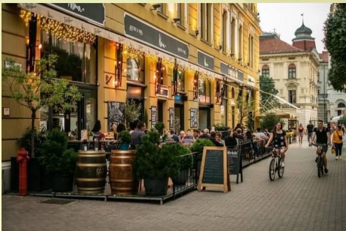
4. ábra: Nana Bistro & Bar a Király utca nyugati végén

A dzsentrifikált Lower East Side-i imáztól az utcában haladva hamar elérkezünk a camdeni stílust idéző festményekkel és kulturálisrendezvényekkel operáló, színes, már-már bohémnak mondható városrészbe, mely többek között a kérdőív egyik leggyakrabban említett vendéglátóhelyének, a Nappali Bárnak is otthont ad.