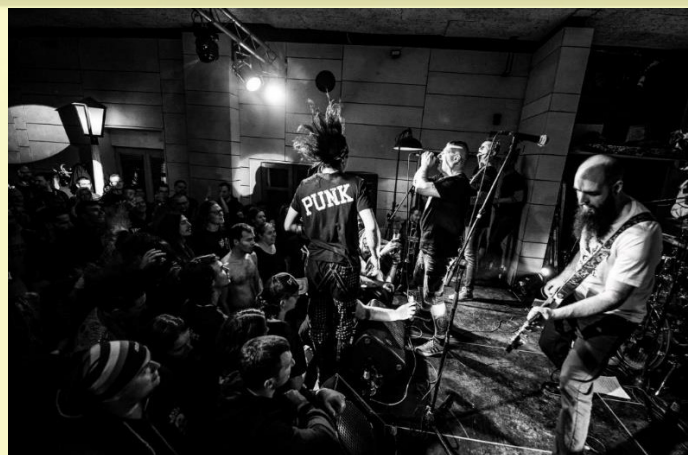
6. ábra: Hétköznapi Csalódások koncert a Szabadkikötőben

Szubkultúrák tekintetében ugyanakkor a Szabadkikötő esetében csupán feltevésekre támaszkodhatunk,