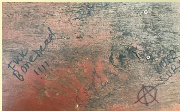
10. ábra: A politikai identitás megjelenése szubkulturális szinten a Csinos Presszóban.

Ezeket a jelzéseket nem lehet street artként kezelni, céljuk egyértelműen a figyelemfelhívás és az identitás kinyilvánítása. Gyakran előkerülő elemek a humor, amely sokszor kapcsolódik az aktuálpolitikához, a futball, leg-