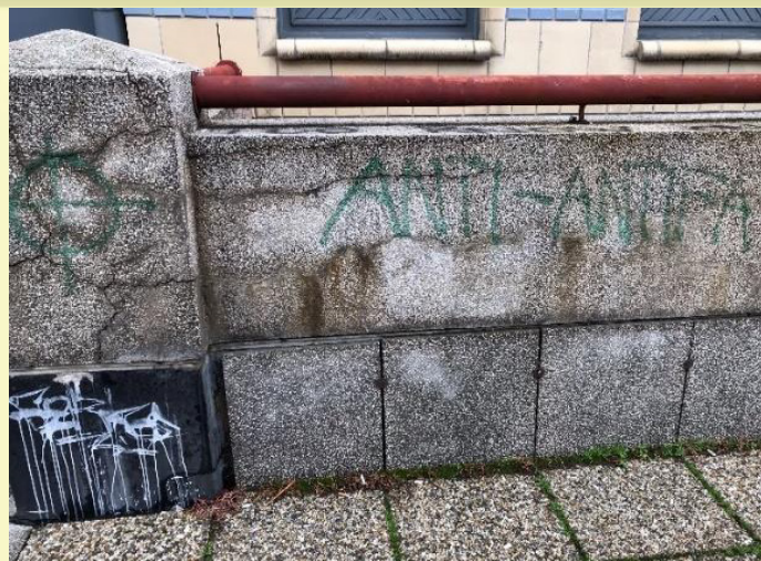
1. ábra: Anti-antifa, valamint white pride logó Pécsen.

Maga a helyszín régóta funkcionál csomópontként, ez a kérdőívekre adott válaszokból is jól látszik, ugyanis arányaiban véve magas számban jelölték meg olyan idősebb (Jellemzően harmincadik évüket betöltött, vagy ahhoz közel járó) személyek, akik magukat valamely szubkul-